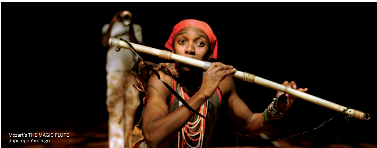
Mozart's THE MAGIC FLUTE Impempe Yomlingo

Con The Magic Flute - Impempe Yomlingo il capolavoro mozartiano da Singspiel si fa musical (e come tale ha ottenuto il prestigioso "Olivier Award"). E se il luogo dell'azione era un fantastico e fiabesco Egitto ora l'ambientazione che ne dà il regista Mark Dornford-May , che ha concepito questa trasposizione (dopo lo splendido U-Carmen Ehkayelitsha , in lingua Xhosa, la cui versione cinematografica ha ottenuto l'Orso d'oro al Festival di Berlino del 2005), è quella - attraversando tutto il continente africano - di un Sudafrica che oscilla tra modernità e passato tribale. Ma è uno sguardo questa volta dall'interno del continente africano, senza esotismi di maniera quello che ci proporrà Isango Portobello, compagnia teatrale di Cape Town, probabilmente la più importante realtà teatrale di colore attiva nel mondo oggi, fondata dallo stesso Dornford-May e dal produttore sudafricano Eric Abraham. La fiaba di Tamino, Pamina, Papageno, Sarastro, della Regina della notte e del perfido Monostatos rivive a Khayelitsha, un popolatissimo sobborgo di Cape Town, assieme a un'orchestra di marimbe che ci ripropone la partitura di Mozart evidenziandone una dimensione 'groove' non così estranea alla musicalità dell' enfant terrible salisburghese.